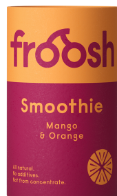
Abbildung / Picture