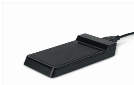
TimeMoto RF-150 USB-RFID-Leser Art.no: 125-0605