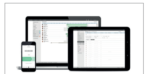
Alternativ Nutzung der TimeMoto Cloud (30-tägige Testversion im Lieferumfang enthalten)