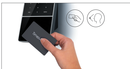
Anmelden durch Auflegen eines RFID-Ausweises, Scannen des Gesichts oder Eingabe einer PIN