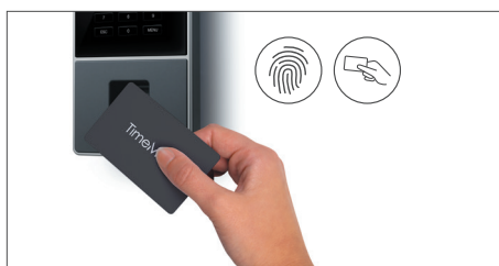
Anmelden durch Auflegen eines RFID-Ausweises, Scannen des Fingerabdrucks oder Eingabe einer PIN