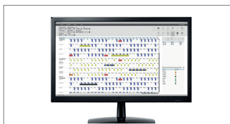
Einschließlich TimeMoto Desktop-Software zur Verwendung an einem einzelnen PC